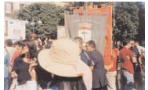
Immagini del Gay Pride di Bari del 2003