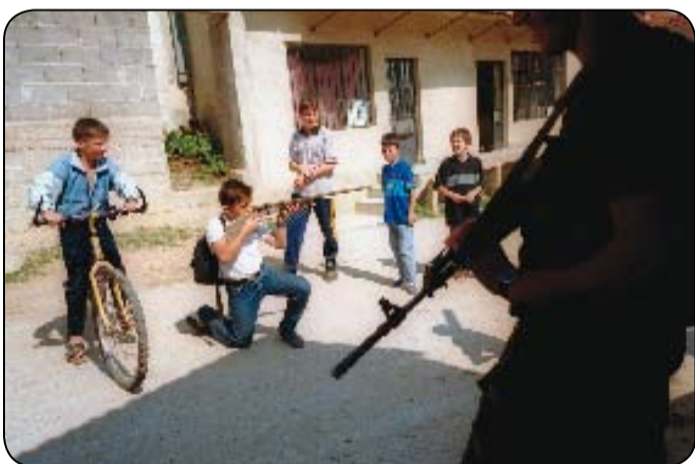
Giovani ragazzi giocano con armi giocattolo in Serbia. Perché la richiesta mondiale di armi venga ridotta è importante che i bambini non siano accostati alle armi come a qualcosa di ineluttabile o di normale nella loro vita quotidiana.