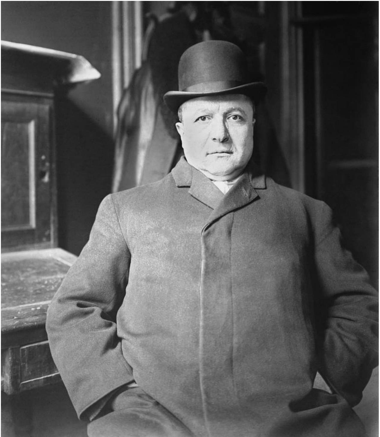
Giuseppe Petrosino, detto Joe [Padula, 30 agosto 1860 - Palermo, 12 marzo 1909]

In un rarissimo dizionario siciliano-italiano, pubblicato a Palermo, nel 1838, la parola Mafia non si trova. Si incontra soltanto in una ristampa dell'opera,