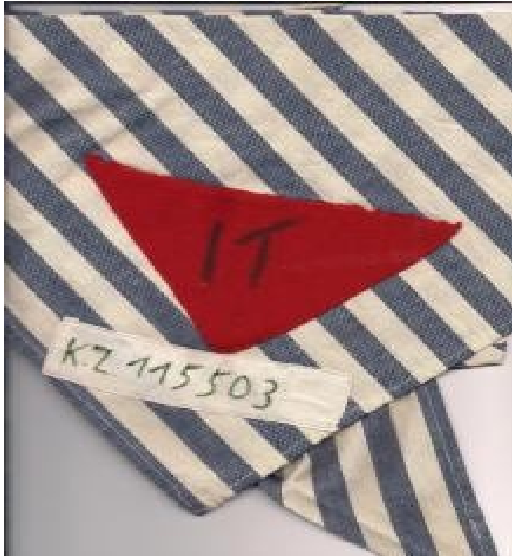
Il fazzoletto di Nunzio